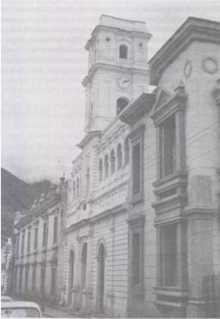
Fachada lateral del Edificio Central de la Univesidad de Los Andes, antes calle 23 y actualmente Boulevard de los pintores