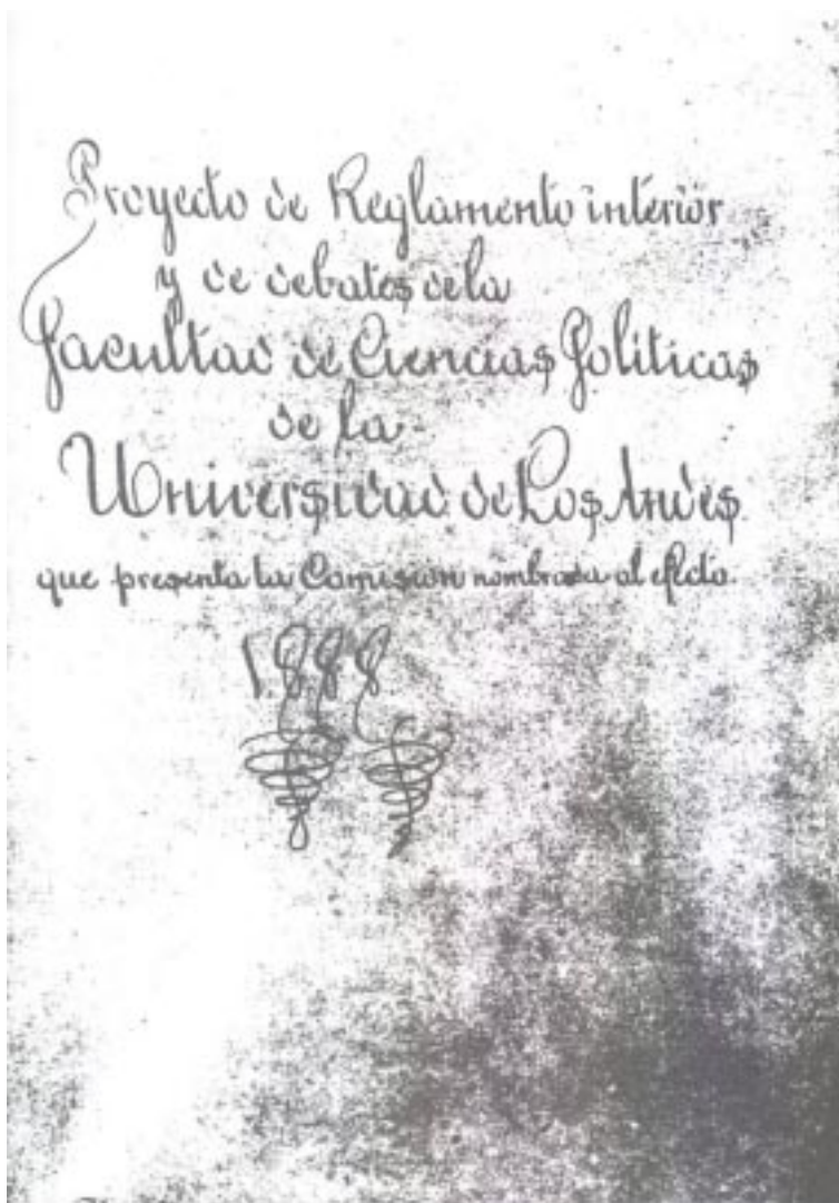
Carátula del Reglamento Interior y de debate de la Facultad de Ciencias Políticas de la Universidad de Los Andes (1888)