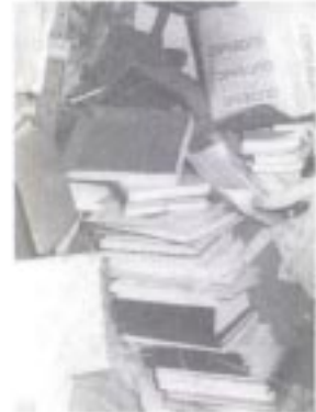
Estado en que se encontraba el Archivo de la Universidad de Los Andes antes de la reorganización reiniciada en 1997