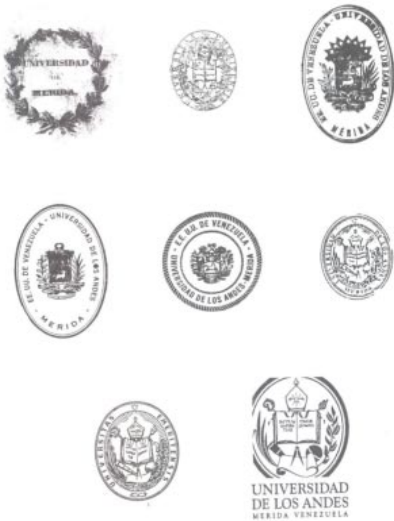
Sellos de la Univesidad