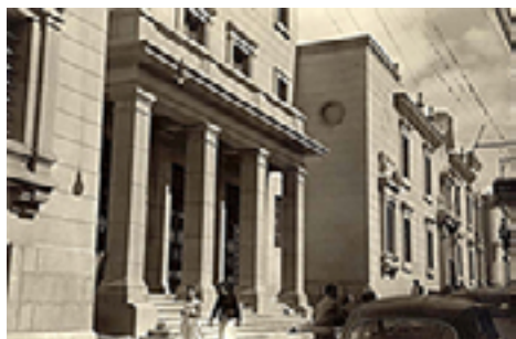
Fachada actual del Edificio Central de la Universidad de Los Andes