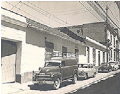
Cuadra universitaria antes de la ampliación del Edificio Central