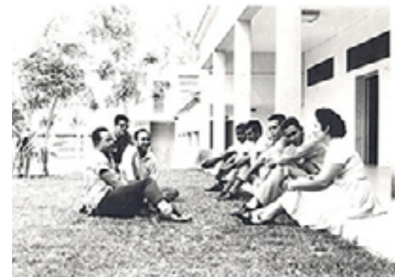
Antigua sede de la Facultad de Ingeniería de la ULA