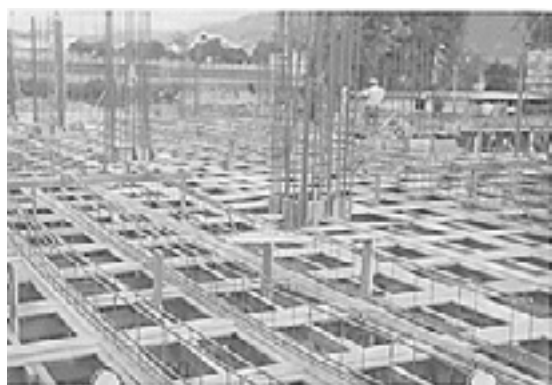
Construcción del Edificio Administrativo 1969

Una vez terminado el Edificio era fundamental realizar las estimaciones para el mejor aprovechamiento de los espacios que serían destinados para dependencias universitarias 19 , –cuidando que las dependencias que hasta entonces venían funcionando en locales alquilados, al mudarse al Edificio tuvieran una justa compensación, es decir que no desmejoraran sus condiciones– y para entes particulares, privando el criterio de que “el Edificio ha de pagarse por sí mismo en un tiempo apropiado, con los egresos por los pagos de alquileres a los antiguos arrendatarios y los ingresos por concepto de arrendamiento de locales comerciales y profesionales.” 20 Esto consistía en que todas las dependencias universitarias que anteriormente ocupaban locales alquilados (Administración, Personal, Presupuesto, Planeamiento, Control Docente, Centro de Jurisprudencia, Biblioteca Central, Biblioteca Universitaria, Dirección de Cultura e Instituto de Investigaciones Económicas), al mudarse al Edificio Administrativo debían ocupar espacios atendiendo a los criterios de equivalencia “entre renta y área útil” , lo que se traducía en la ocupación de solo dos plantas. Las restantes serían arrendadas a particulares u ocupadas por otras dependencias universitarias no incluidas en las anteriores.