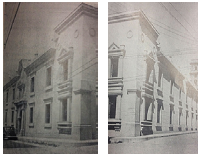
Edificio Principal de la Universidad 1937

Para el año de 1935 se inicia la demolición de la antigua casona en la cual había funcionado la Universidad desde 1824 y que desde 1890 el Dr. Caracciolo Parra y Olmedo había convertido en sede principal de la Institución. Las disposiciones del gobierno nacional de proceder a la construcción de nuevas instalaciones para la Universidad, abren el camino para la edificación de una magnífica estructura que sería de ahora en adelante la sede central de la Institución emeritense 3 . La nueva construcción, inaugurada el 23 de marzo de 1937, constituía para el momento un adelanto arquitectónico acorde con la grandeza y exigencias de la Universidad de Los Andes.