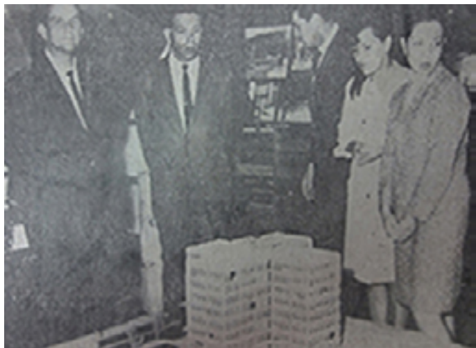
Exposición del Plan de Edificaciones de la Universidad de Los Andes en el Paseo de la Feria 1967