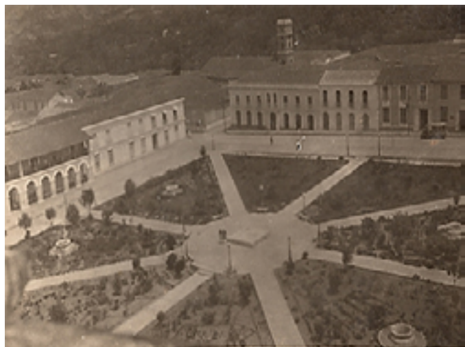
Plaza Bolívar. Al fondo la esquina este de la Universidad de Los Andes

Para el año de 1935 se inicia la demolición de la antigua casona en la cual había funcionado la Universidad desde 1824 y que desde 1890 el Dr. Caracciolo Parra y Olmedo había convertido en sede principal de la Institución. Las disposiciones del gobierno nacional de proceder a la construcción de nuevas instalaciones para la Universidad, abren el camino para la edificación de una magnífica estructura que sería de ahora en adelante la sede central de la Institución emeritense 3 . La nueva construcción, inaugurada el 23 de marzo de 1937, constituía para el momento un adelanto arquitectónico acorde con la grandeza y exigencias de la Universidad de Los Andes.