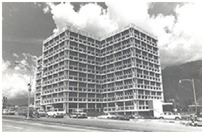
Edificio Administrativo de la Universidad de Los Andes 1972

quienes permanecieron allí hasta mediados de los setenta. Sólo un ala de la planta baja estuvo arrendada hasta finales de los ochenta, y una vez que cesaron los compromisos de alquiler se procedió a reubicar en esta área la Biblioteca Central “Tulio Febres Cordero”.